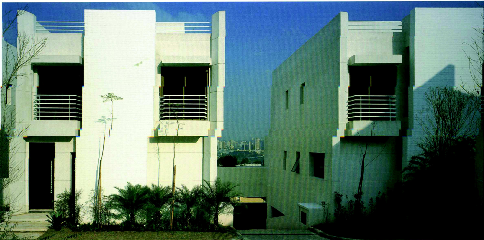
A composição cuidadosa da fachada, tratando proporcionalmente os cheios e vazios, cria uma diversidade de planos.

To further value the shared external areas and create a dialog with the modern lines of the architectural project, the landscaping, created by Martha Gavião and done by Vila Jardins, used light colored flagstones mixed with a dense, mid-height vegetation. Of note, also, the large darkened wood doors created by Carla Dichy, enhancing the houses' entry. Among the benefits offered are the Siemens' services, with the latest generation alarm and sensor systems installed in strategic locations of the condominium.